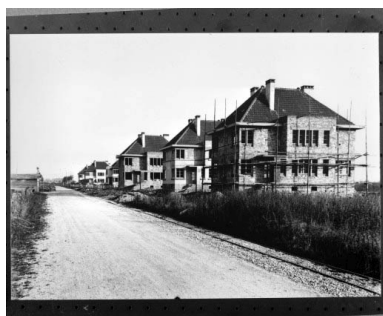
Maisons de même type en construction, groupe Z.