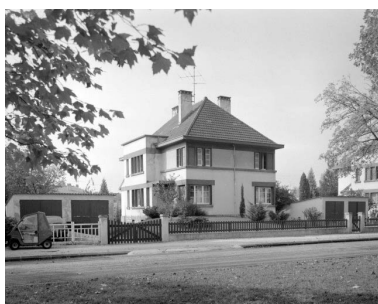
Maison identique 40, 42 avenue Clémenceau.