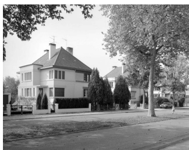
Maison identique, 32, 34 avenue Clémenceau.