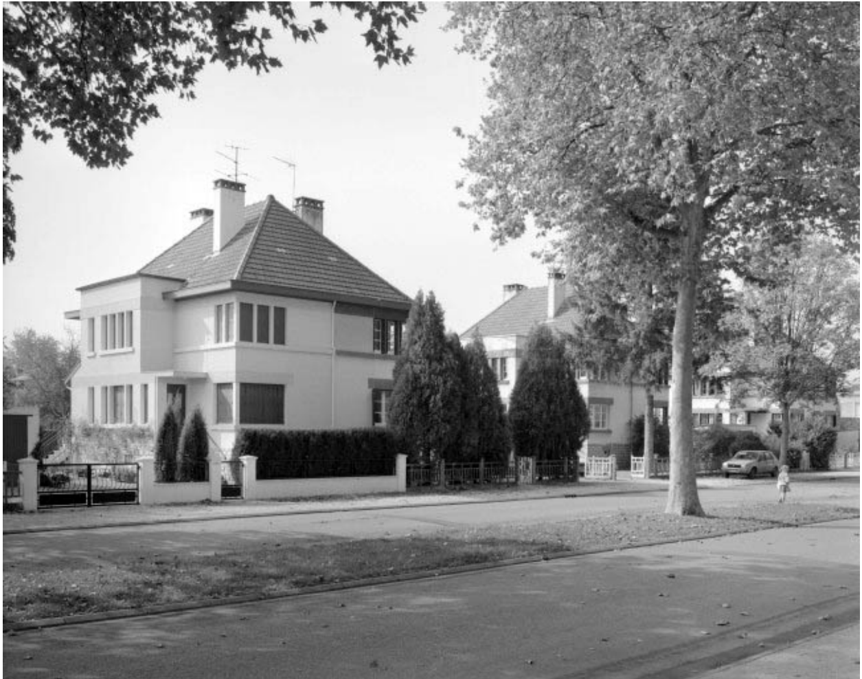
Maison identique, 32, 34 avenue Clémenceau.