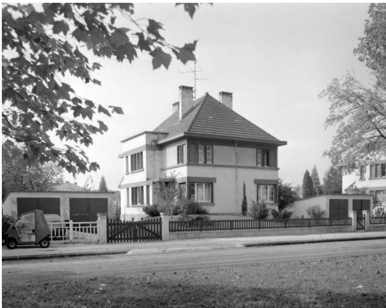
Maison identique 40, 42 avenue Clémenceau.