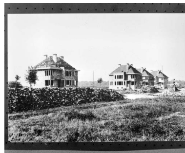
Maison de même type en construction, groupe Z.