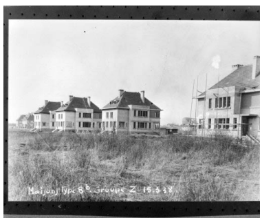
Maisons de même type en construction, groupe Z.