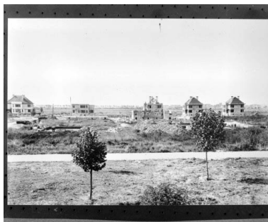
Maisons de même type en construction, groupe Z. IVR43_19903900130X