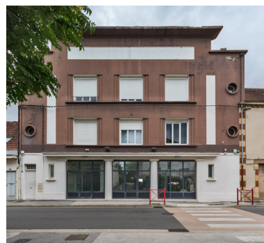
Façade antérieure. IVR26_20257100950NUC4A