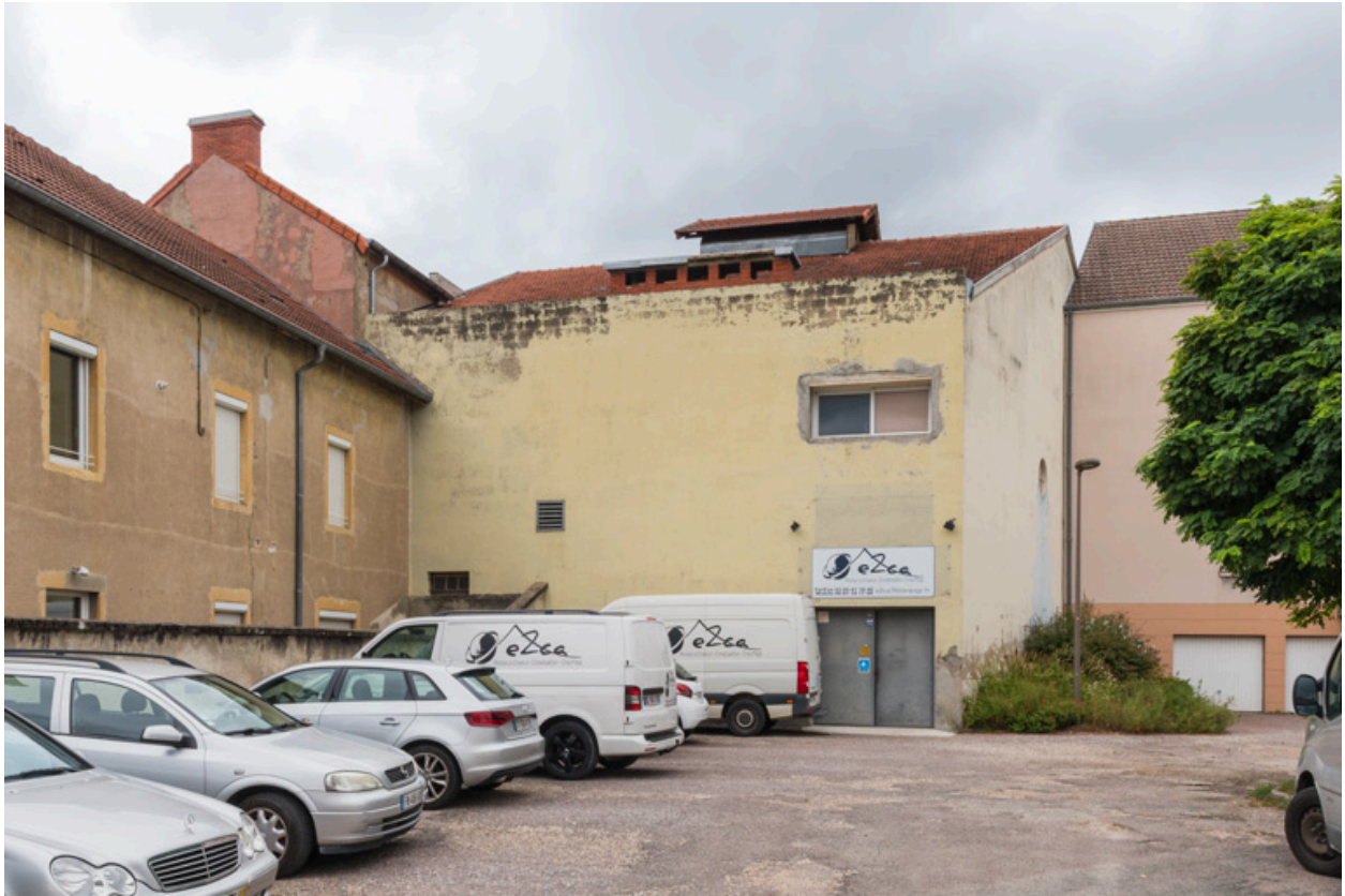
Façades latérale droite et postérieure.