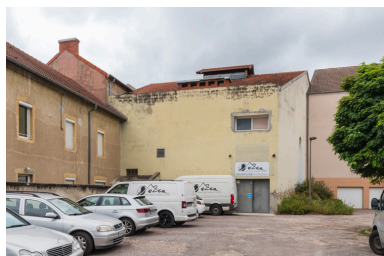
Façades latérale droite et postérieure. IVR26_20257100949NUC4A