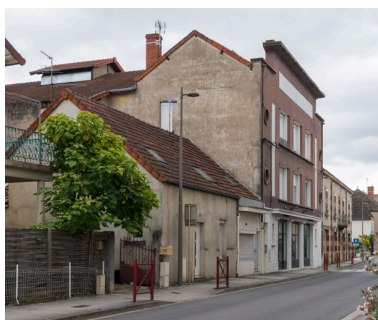
Vue d'ensemble, depuis le nord. IVR26_20257100951NUC2A