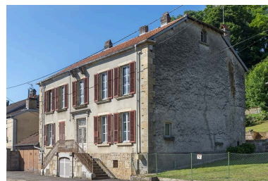
Rue Thiers, trois quarts de la demeure n° 106. IVR43_20217000352NUC4A