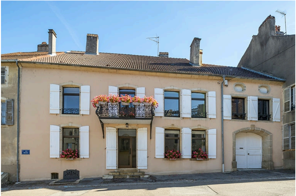
Rue Thiers, n° 2.