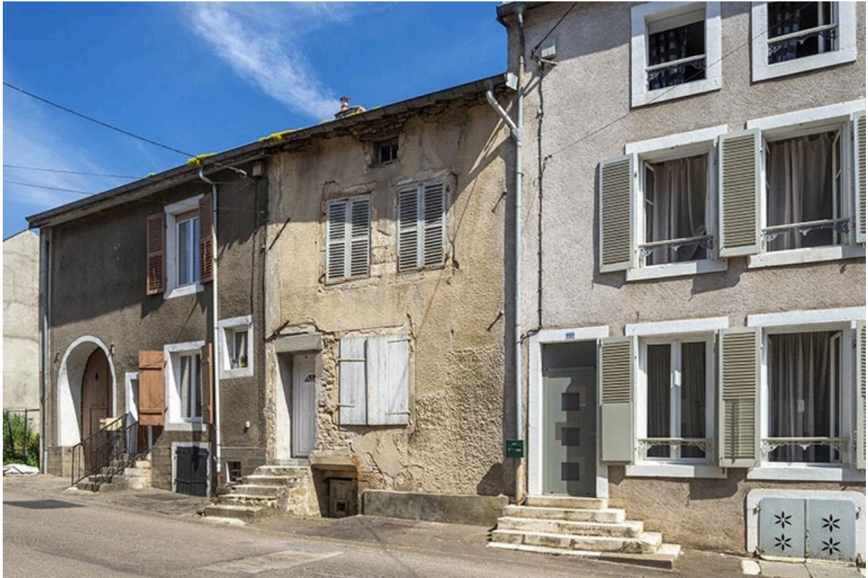
Rue Thiers, alignement du côté pair devant le n° 22, vue vers le nord-est.