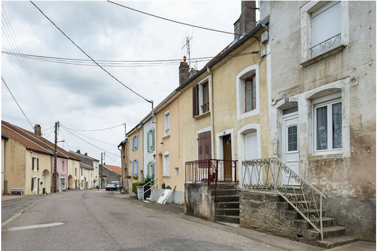
Rue Thiers, alignement du côté pair devant le n° 36, vue vers le nord-est.