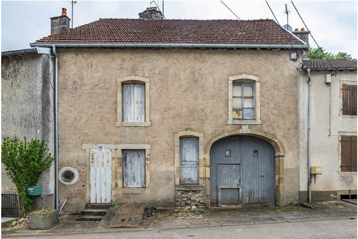
Rue Thiers, maison au n° 60.