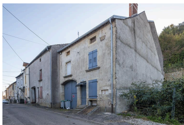
Rue Thiers, alignement du côté pair devant le n° 32, vue vers le nord-est.