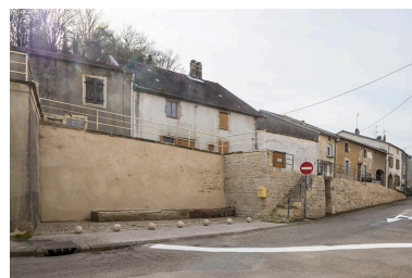
Rue Thiers, trois quarts gauche de la fontaine dite Petite fontaine et de l'abreuvoir, à hauteur du n° 74. IVR43_20227000054NUC4A