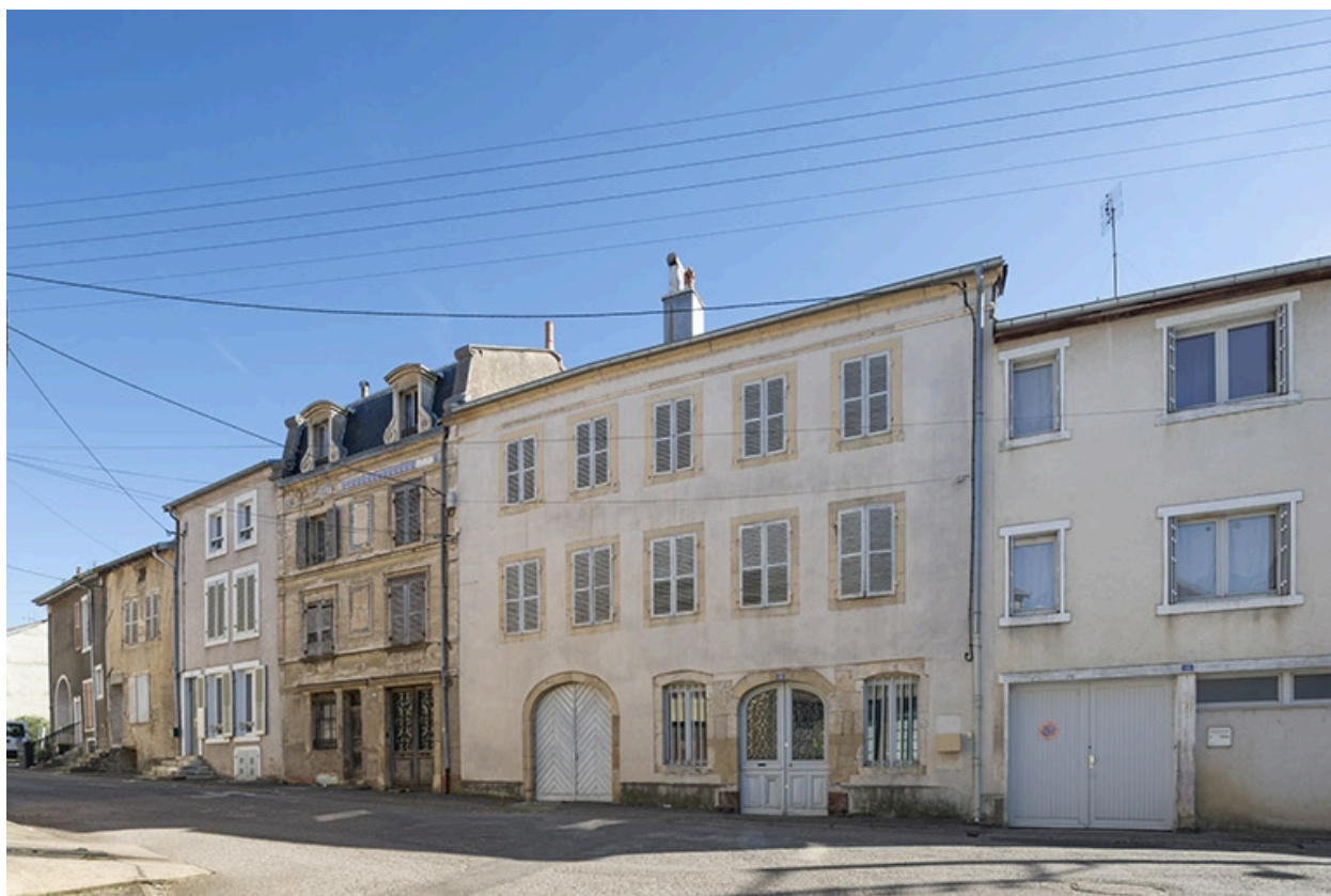
Rue Thiers, alignement du côté pair devant le n° 16, vue vers le nord-est.