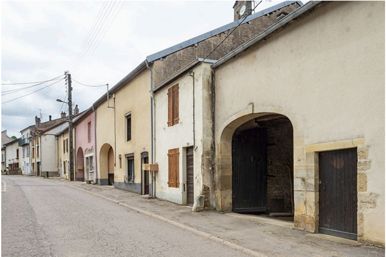
Rue Thiers, alignement du côté impair devant le n° 45, vue vers l'ouest.