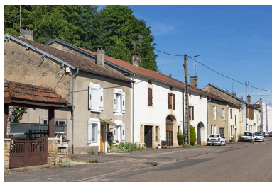
Rue Thiers, alignement des façades du côté pair vers le nord-ouest, à hauteur du n° 102. IVR43_20217000350NUC4A