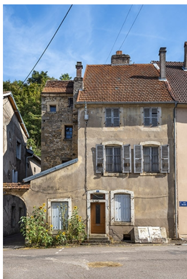
Rue Thiers, n° 4. IVR43_20217000574NUC4A