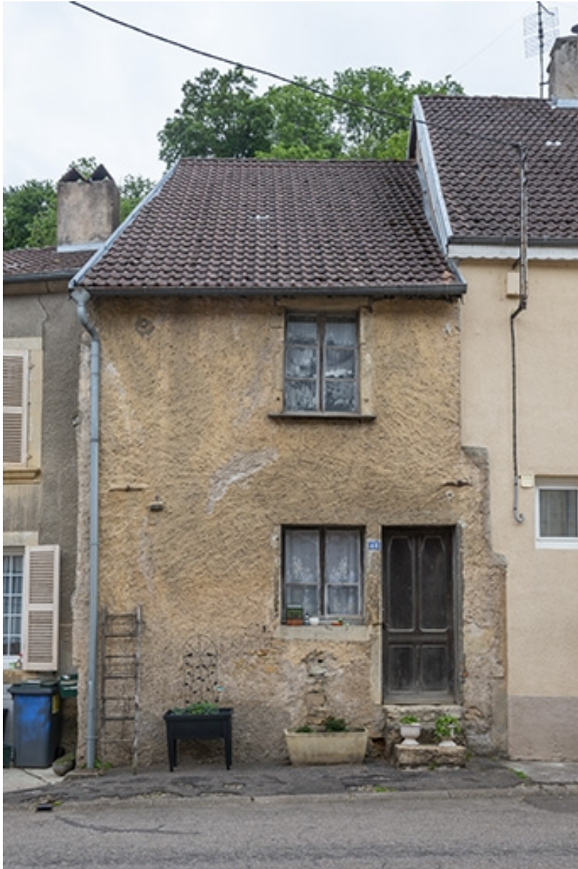
Rue Thiers, façade de la maison au n° 48.