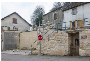
Rue Thiers, trois quarts droit de la fontaine dite Petite fontaine et de l'abreuvoir, à hauteur du n° 74.