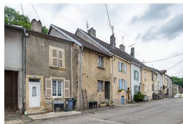
Rue Thiers, alignement du côté pair devant le n° 52, vers le sud-ouest. IVR43_20217000357NUC4A