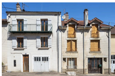
Rue Thiers, façades des maisons n° 31 et 33.