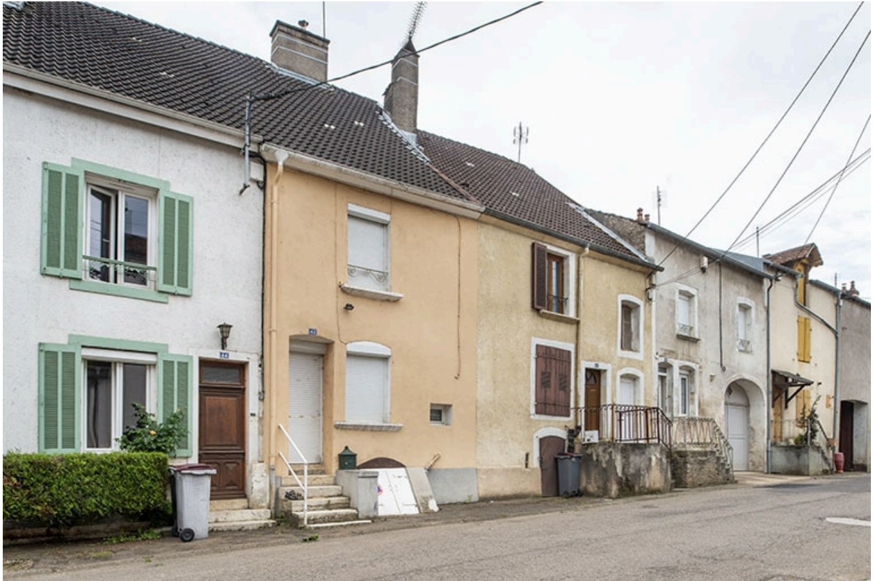
Rue Thiers, alignement du côté pair devant le n° 44, vers le sud-ouest.