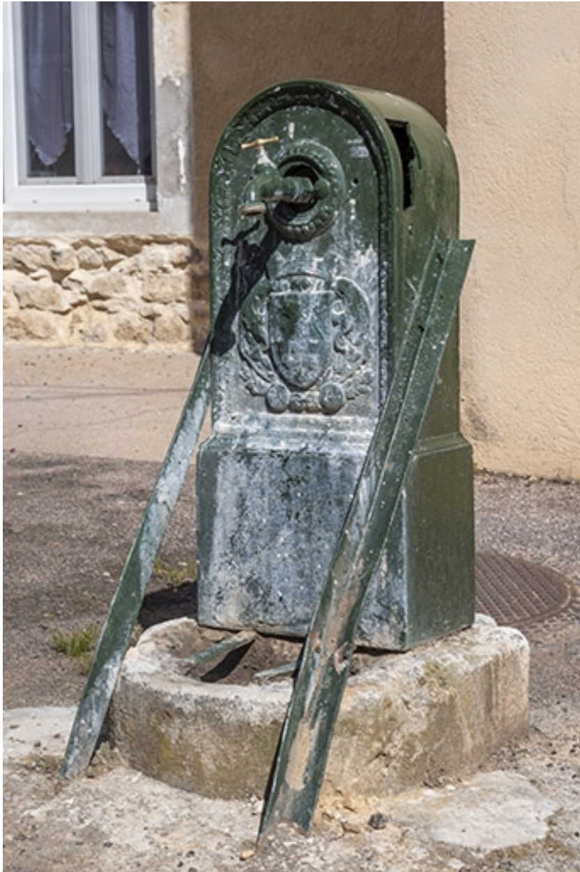
Rue Thiers, la borne fontaine au n° 37.