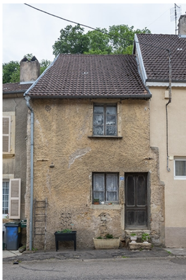
Rue Thiers, façade de la maison au n° 48. IVR43_20217000346NUC4A