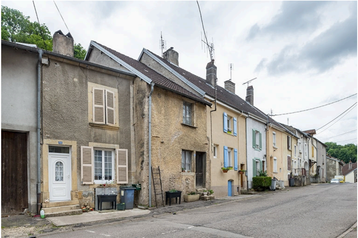
Rue Thiers, alignement du côté pair devant le n° 52, vers le sud-ouest.