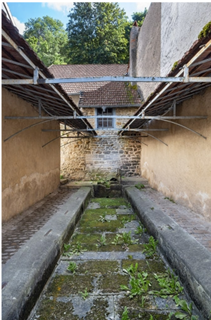
Rue Thiers, la fontaine-lavoir dite de la Jacquemotte (intérieur).