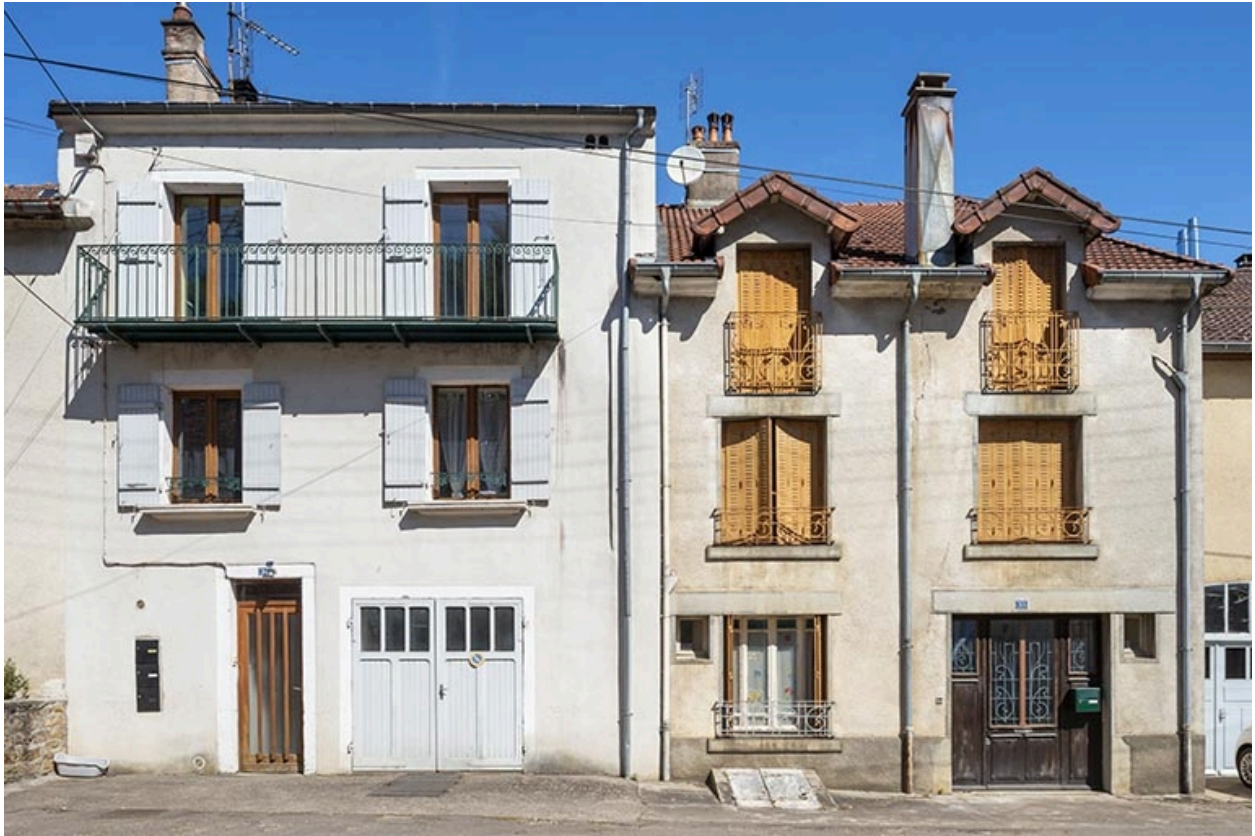
Rue Thiers, façades des maisons n° 31 et 33.