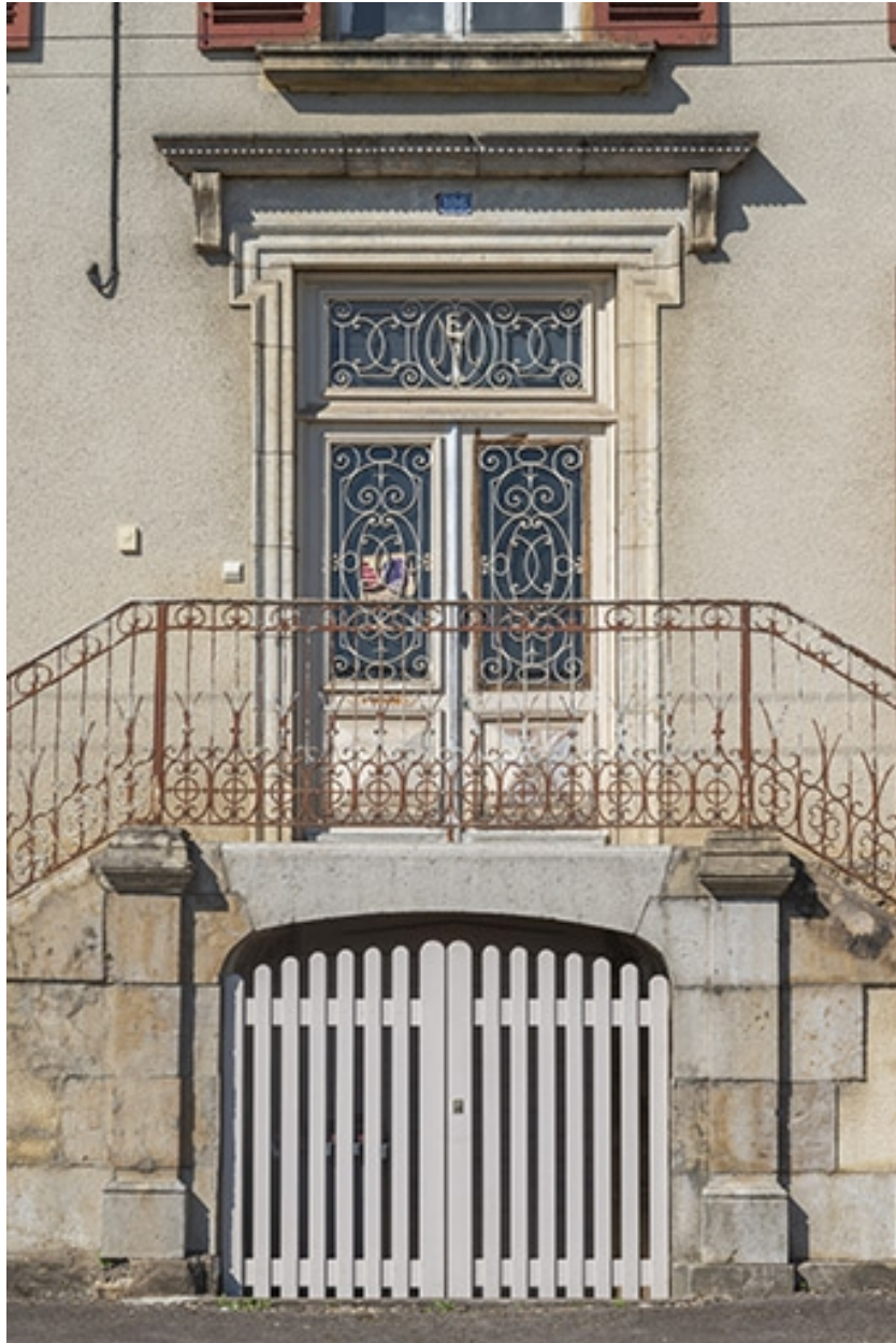
Rue Thiers, entrées de sous-sol et du rez-de-chaussée surélevé de la demeure n° 106.