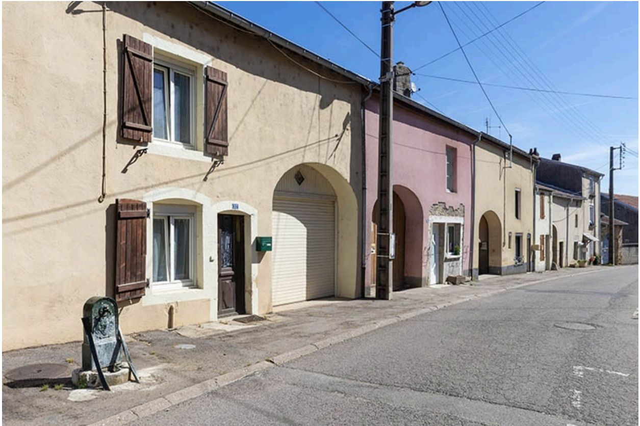
Rue Thiers, alignement du côté impair devant le n° 35, vue vers le nord-est.