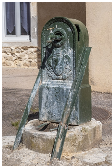
Rue Thiers, la borne fontaine au n° 37. IVR43_20217000342NUC4A