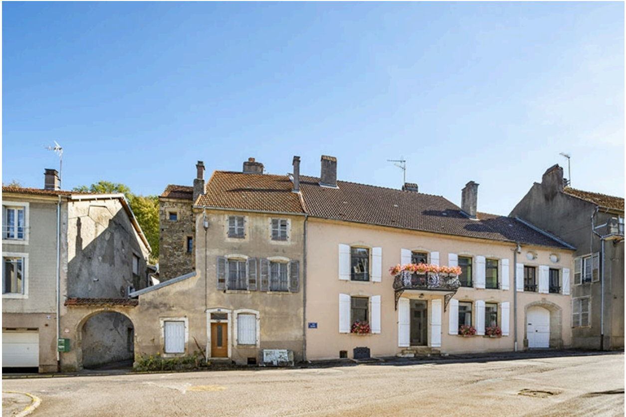
Alignement du côté pair de la rue Thiers (n° 2 à 6).