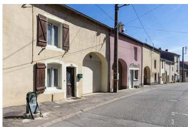
Rue Thiers, alignement du côté impair devant le n° 35, vue vers le nord-est.