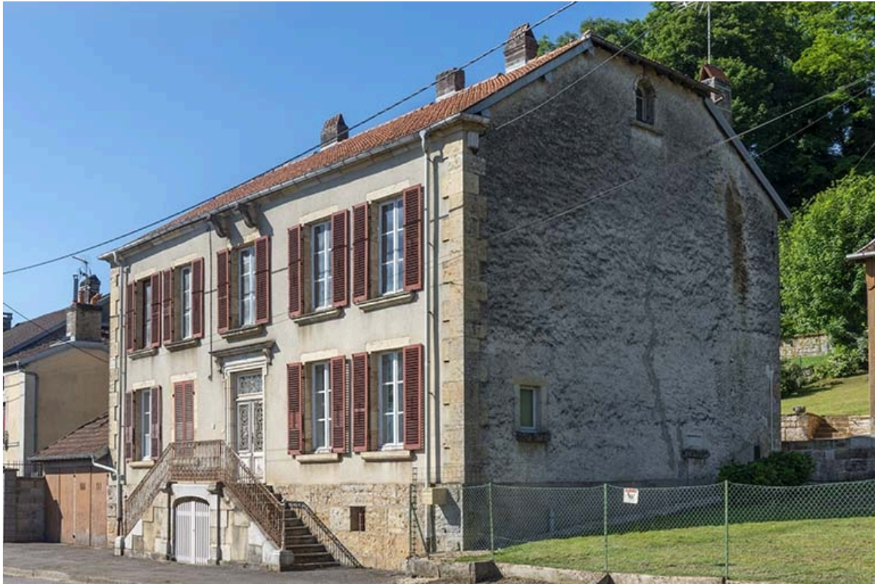
Rue Thiers, trois quarts de la demeure n° 106.