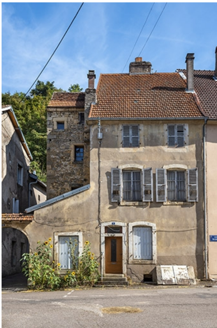
Rue Thiers, n° 4.