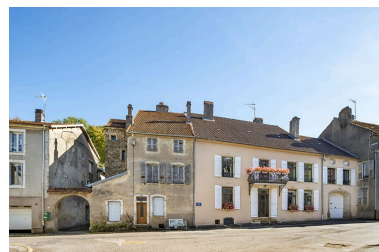
Alignement du côté pair de la rue Thiers (n° 2 à 6). IVR43_20217000681NUC4A