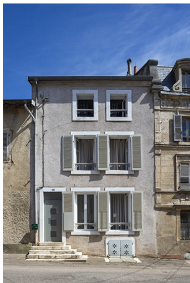
Rue Thiers, façade de la maison n° 22.