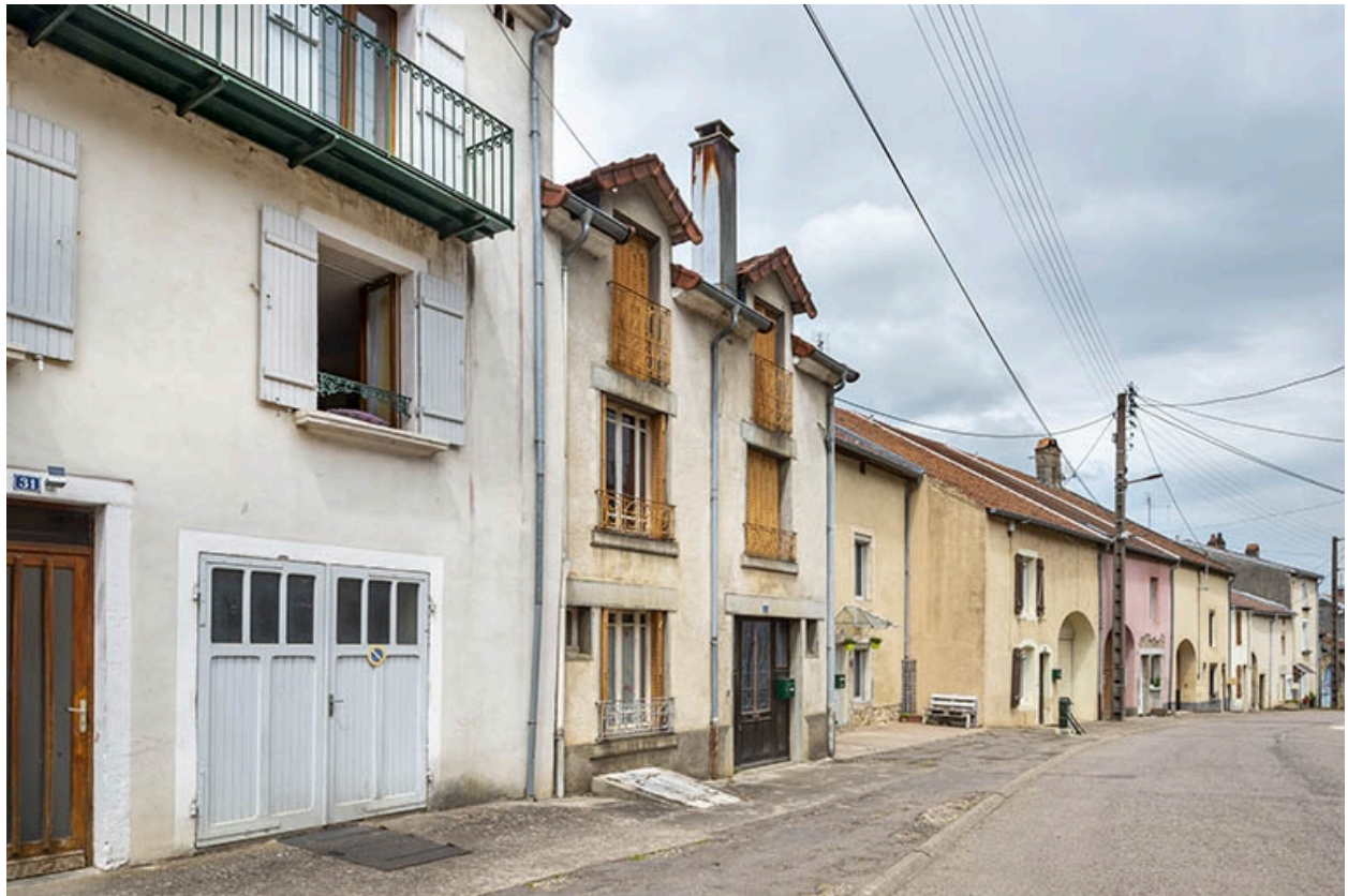
Rue Thiers, alignement du côté impair devant le n° 31, vue vers le nord-est.