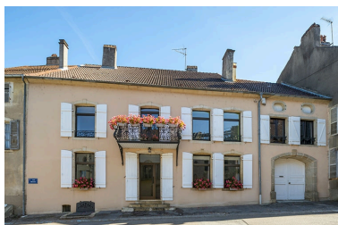
Rue Thiers, n° 2. IVR43_20217000680NUC4A