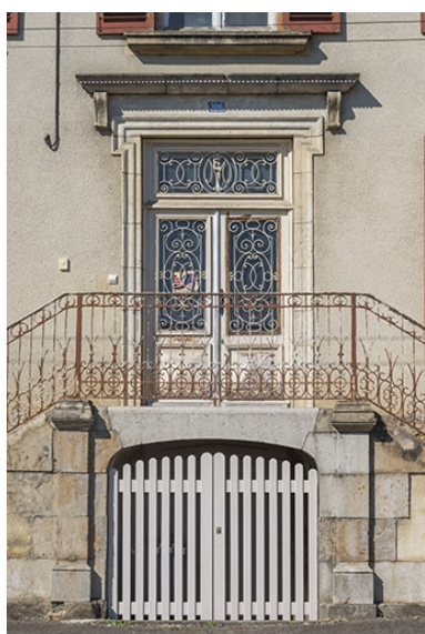
Rue Thiers, entrées de sous-sol et du rez-de-chaussée surélevé de la demeure n° 106. IVR43_20217000353NUC4A