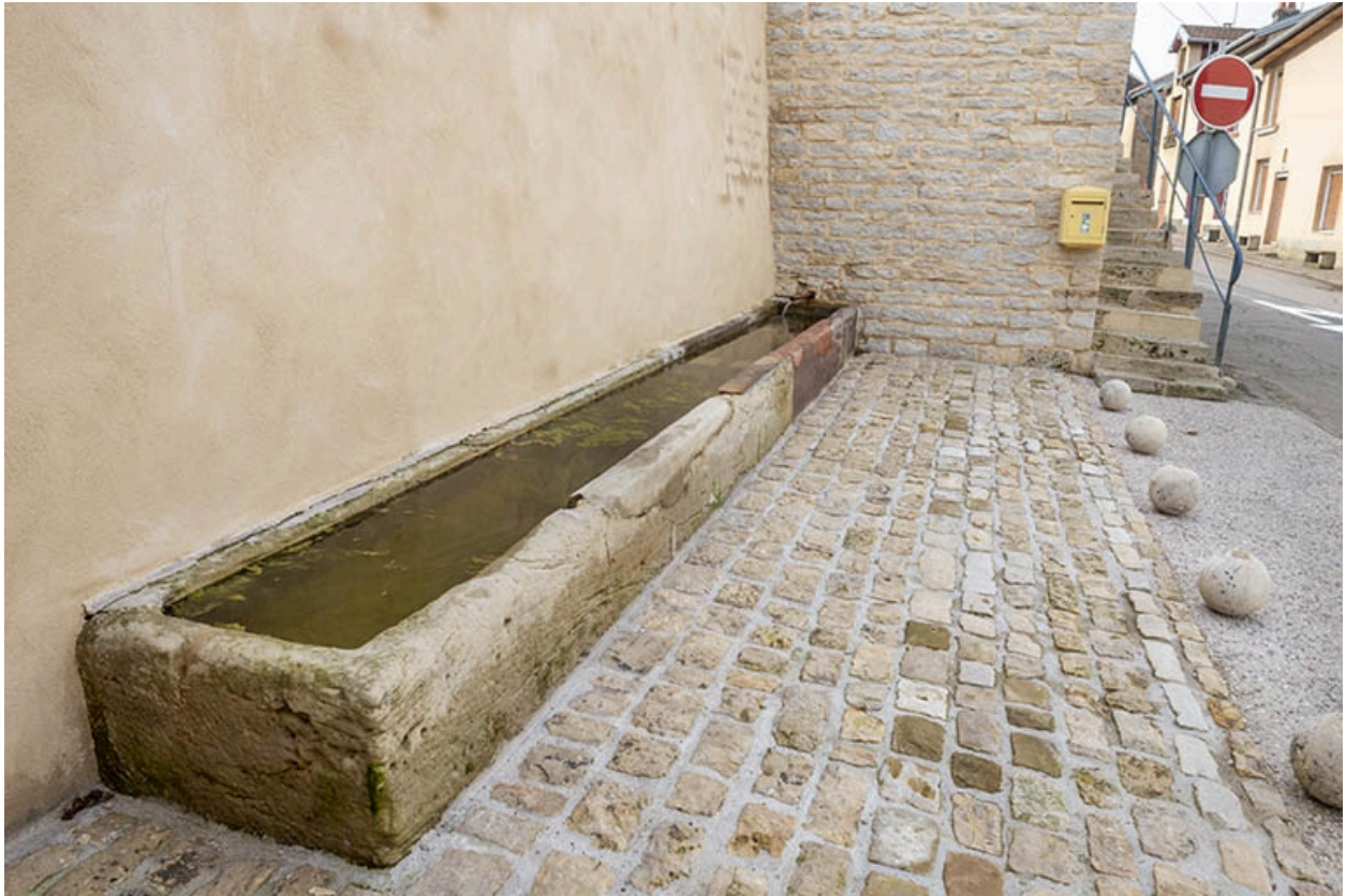
Rue Thiers, trois quarts gauche de l'abreuvoir, à hauteur du n° 74.