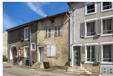
Rue Thiers, alignement du côté pair devant le n° 22, vue vers le nord-est. IVR43_20217000685NUC4A