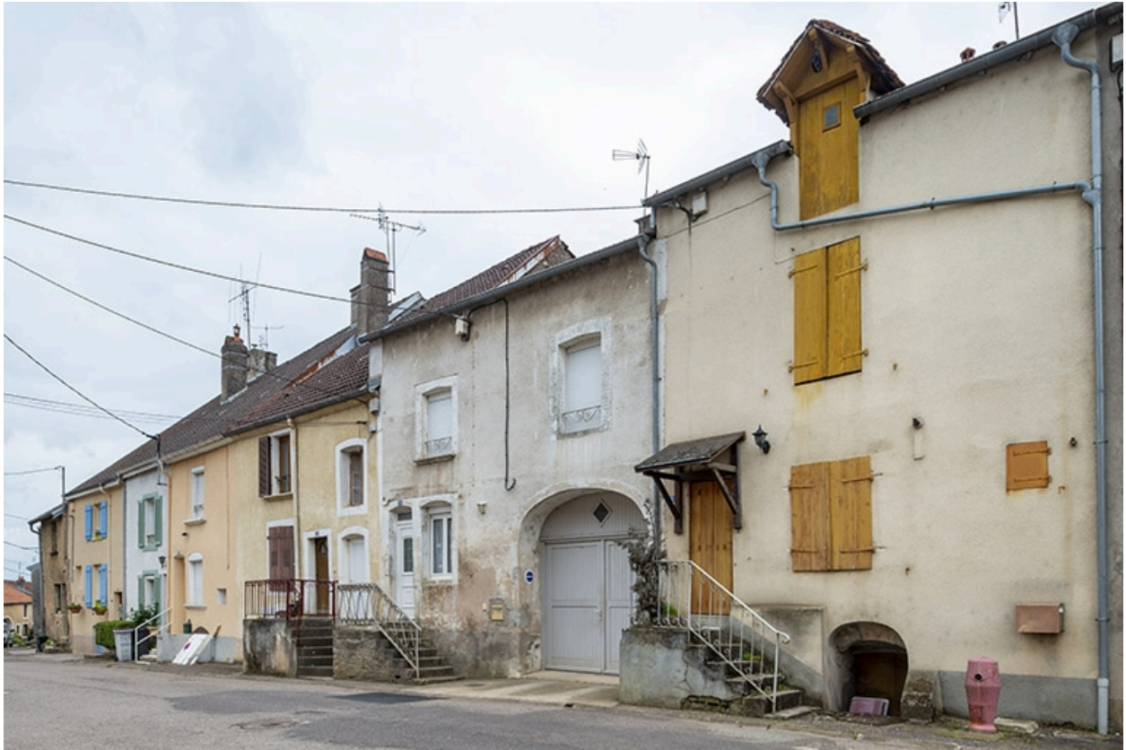
Rue Thiers, alignement du côté pair devant le n° 34, vue vers le nord-est.