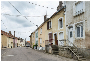
Rue Thiers, alignement du côté pair devant le n° 36, vue vers le nord-est. IVR43_20217000358NUC4A