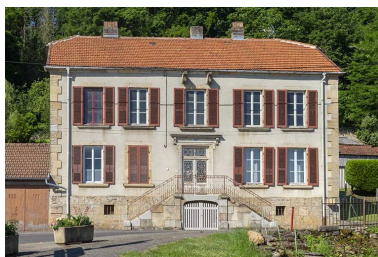
Rue Thiers, façade de la demeure n° 106. IVR43_20217000351NUC4A