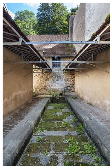
Rue Thiers, la fontaine-lavoir dite de la Jacquemotte (intérieur). IVR43_20217000573NUC4A