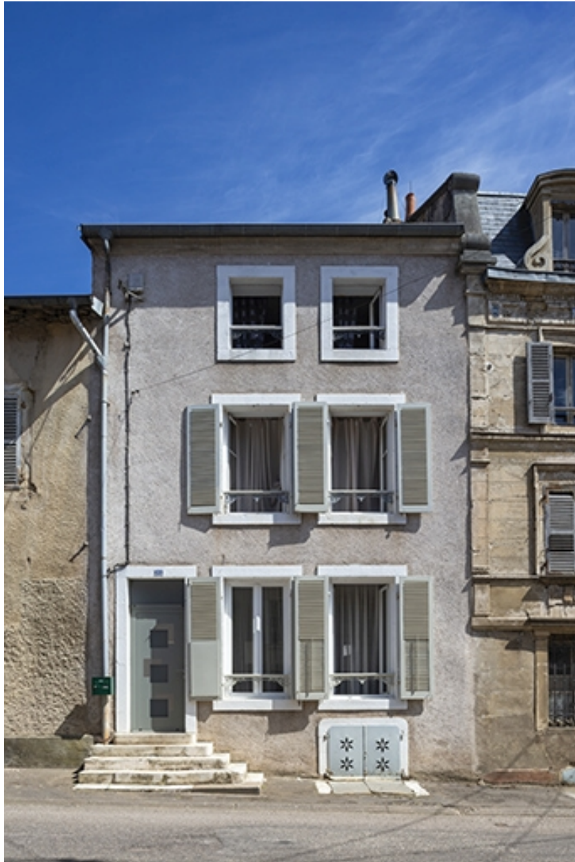
Rue Thiers, façade de la maison n° 22.