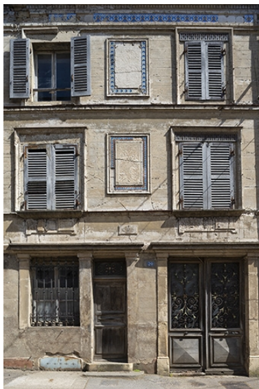
Rue Thiers, façade de l'immeuble n° 20.