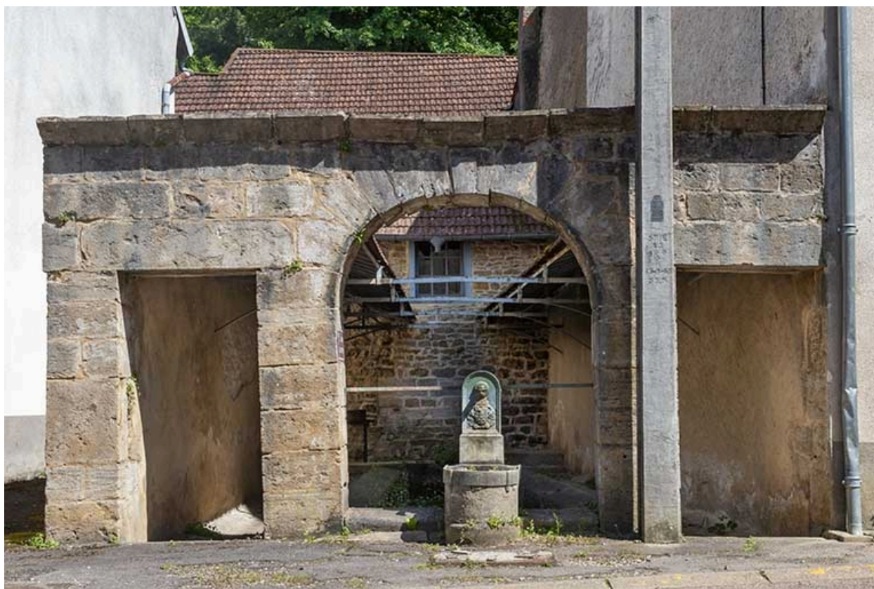
Rue Thiers, la fontaine-lavoir dite de la Jacquemotte.