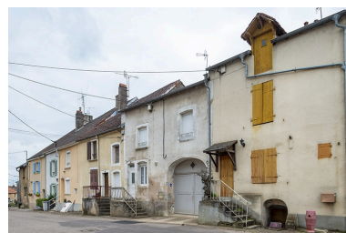
Rue Thiers, alignement du côté pair devant le n° 34, vue vers le nord-est. IVR43_20217000344NUC4A