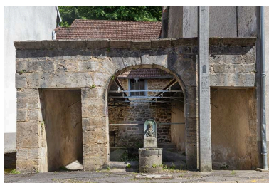
Rue Thiers, la fontaine-lavoir dite de la Jacquemotte.