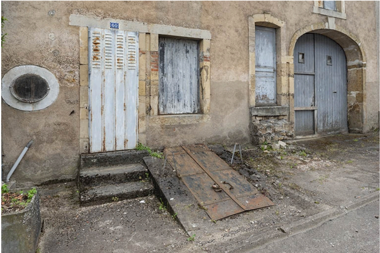
Rue Thiers, rez-de-chaussée du n° 60.