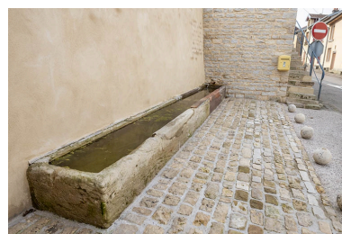
Rue Thiers, trois quarts gauche de l'abreuvoir, à hauteur du n° 74. IVR43_20227000055NUC4A