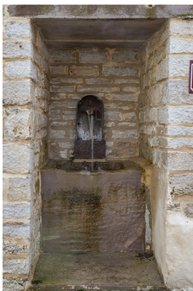
Rue Thiers, fontaine dite Petite fontaine, à hauteur du n° 74. IVR43_20227000053NUC4A