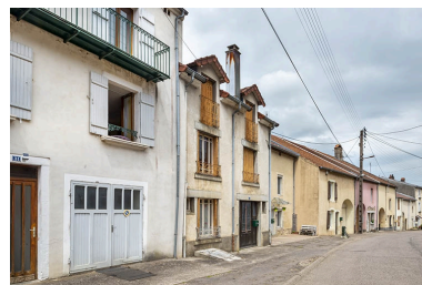
Rue Thiers, alignement du côté impair devant le n° 31, vue vers le nord-est.