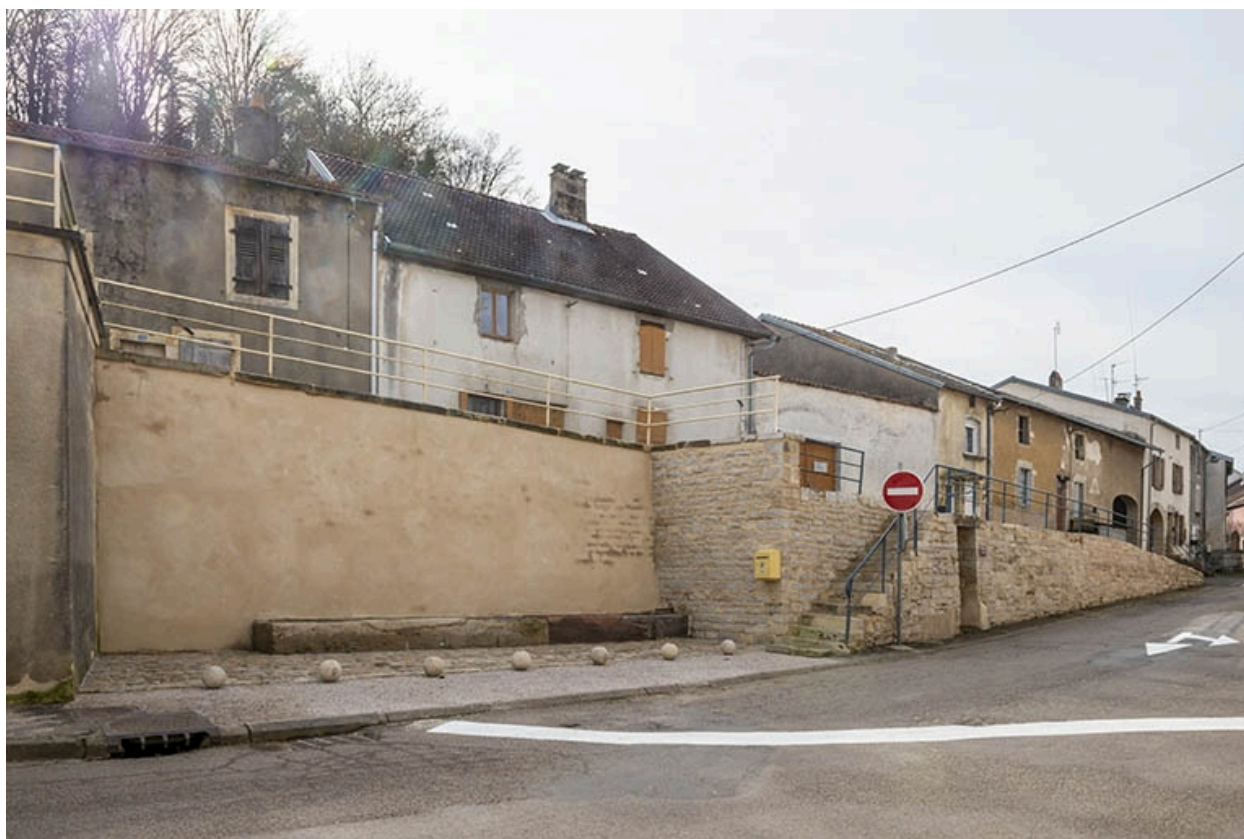
Rue Thiers, trois quarts gauche de la fontaine dite Petite fontaine et de l'abreuvoir, à hauteur du n° 74.