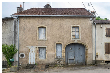
Rue Thiers, maison au n° 60. IVR43_20217000347NUC4A