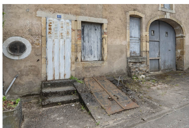
Rue Thiers, rez-de-chaussée du n° 60. IVR43_20217000348NUC4A