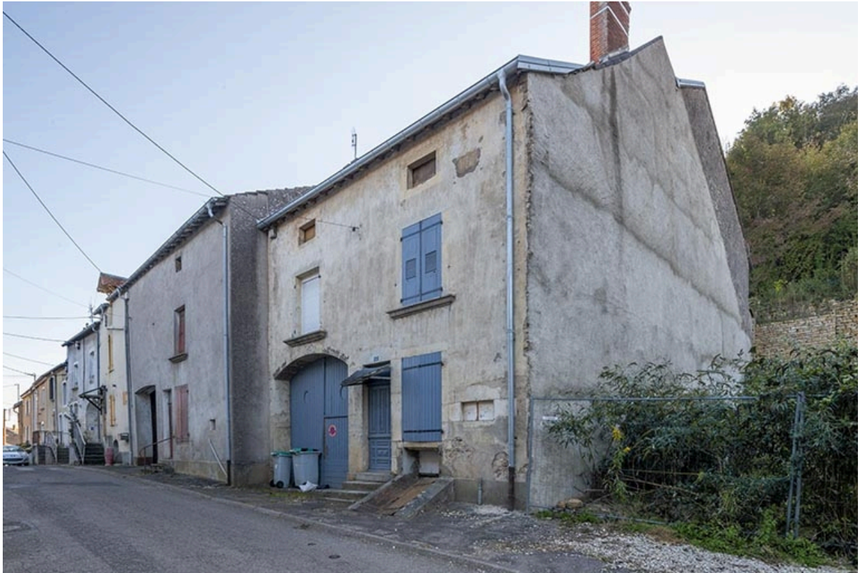
Rue Thiers, alignement du côté pair devant le n° 32, vue vers le nord-est.