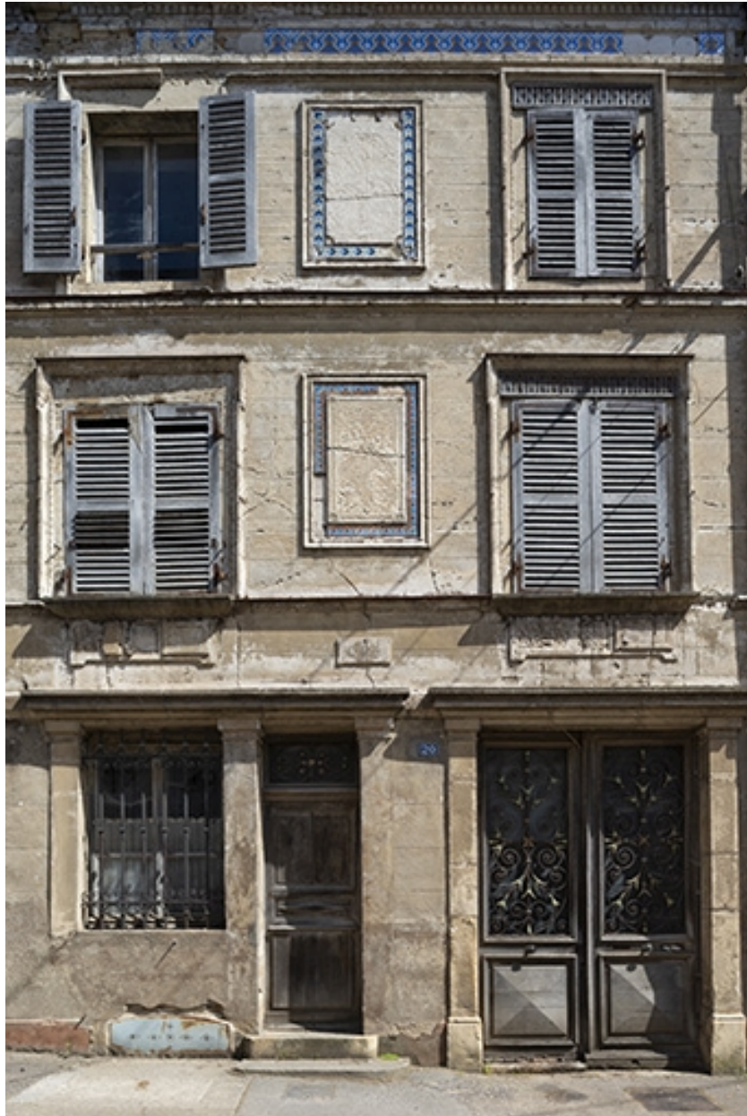
Rue Thiers, façade de l'immeuble n° 20.