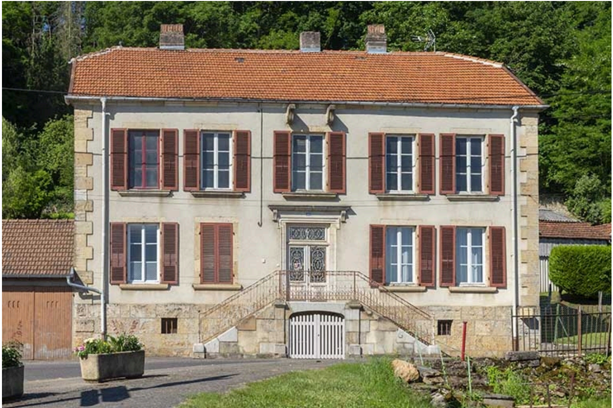
Rue Thiers, façade de la demeure n° 106.