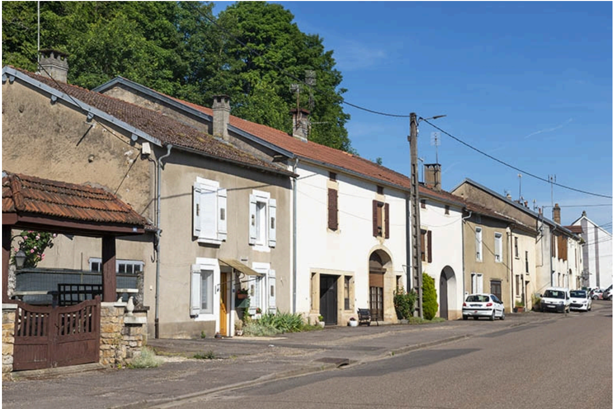
Rue Thiers, alignement des facades du côté pair vers le nord-ouest, à hauteur du n° 102.