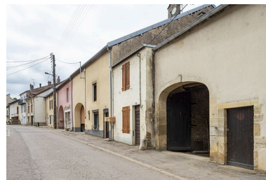
Rue Thiers, alignement du côté impair devant le n° 45, vue vers l'ouest. IVR43_20217000355NUC4A