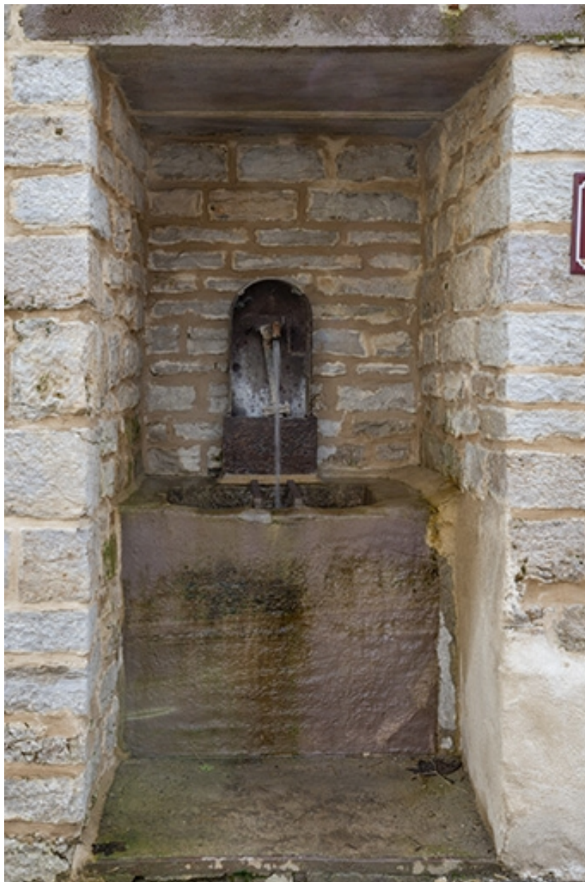
Rue Thiers, fontaine dite Petite fontaine, à hauteur du n° 74.