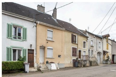
Rue Thiers, alignement du côté pair devant le n° 44, vers le sud-ouest. IVR43_20217000356NUC4A