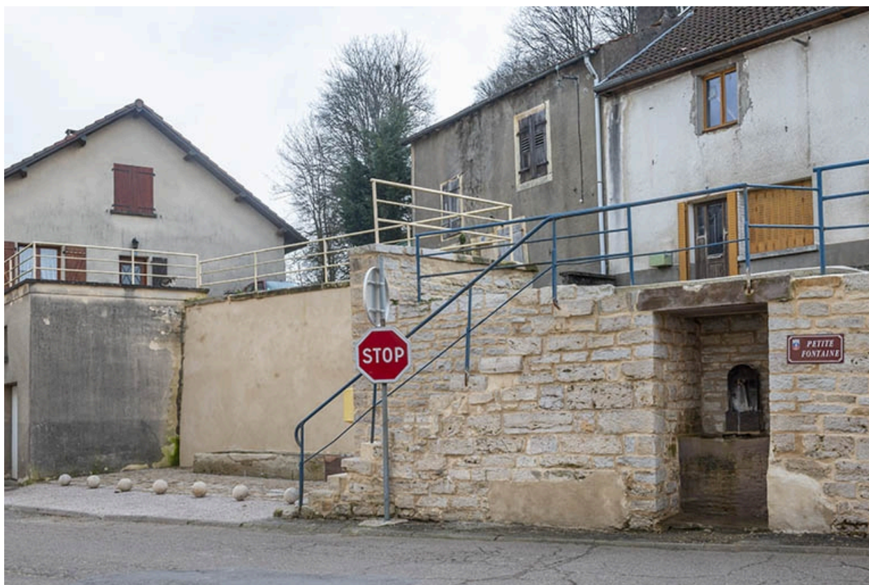
Rue Thiers, trois quarts droit de la fontaine dite Petite fontaine et de l'abreuvoir, à hauteur du n° 74.