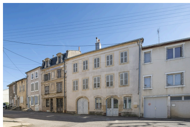
Rue Thiers, alignement du côté pair devant le n° 16, vue vers le nord-est. IVR43_20217000682NUC4A