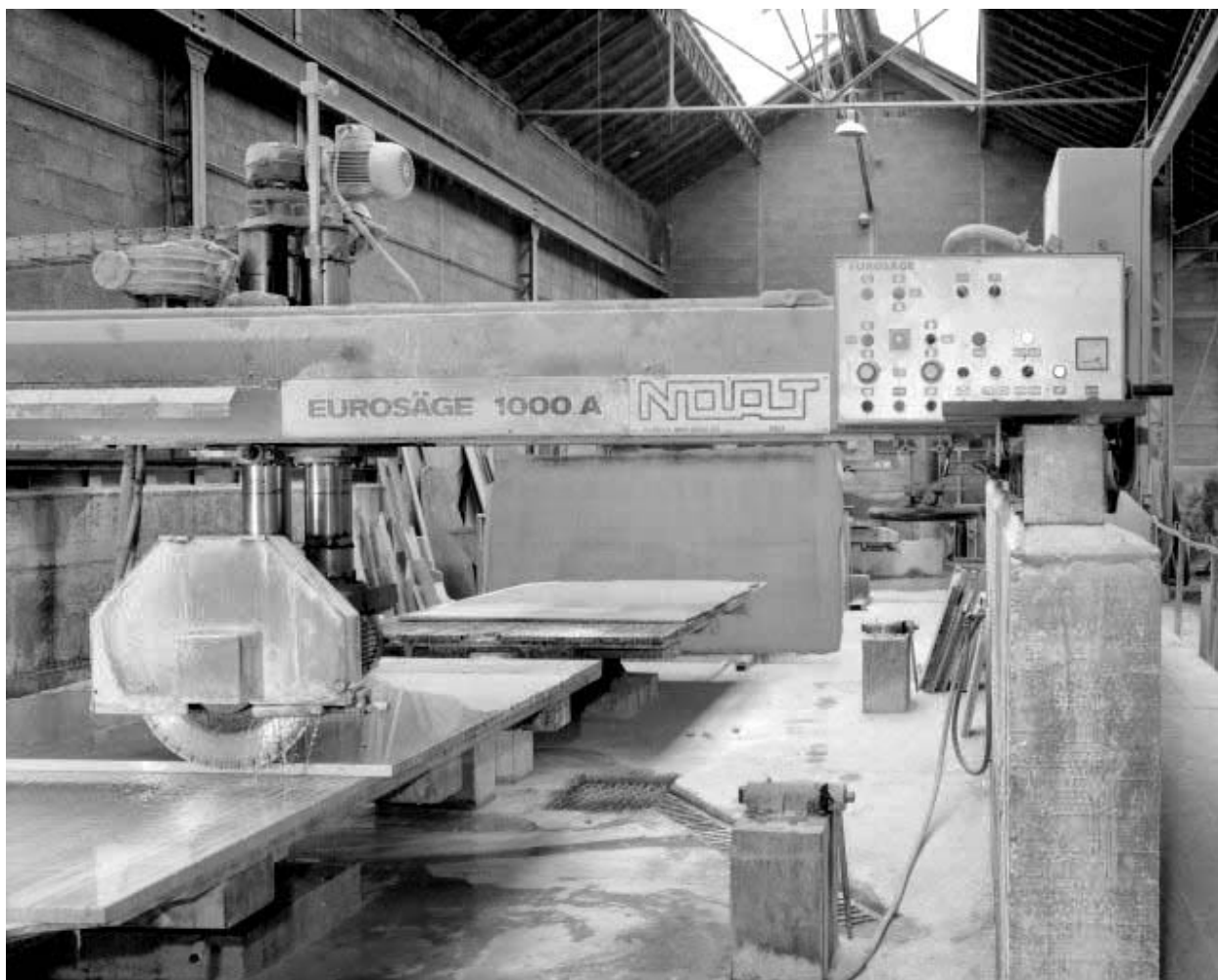
Lame circulaire et armoire de commande.