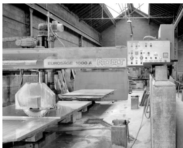
Lame circulaire et armoire de commande.